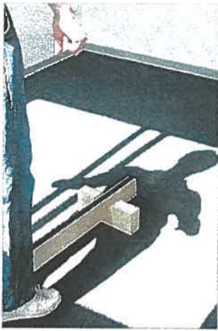
Journalisten på balancebommen

Det drejer sig nemlig om, at en del børn eksempelvis har svage område med øjnene. Deres samsyn samt evne